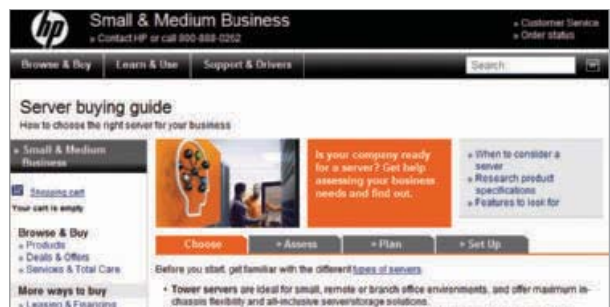
HP Server buying guide，網址是 http://tinyurl.com/nsky7