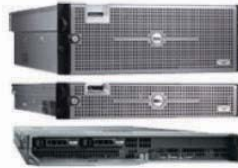
Introducing six new Dell PowerEdge servers powered by the Six-Core AMD Opteron™ processor

你所選擇的處理器平臺，將影響伺服器本身能搭配的記憶體類型。一般來說，DDR 2 SDRAM記憶體是目前多數伺服器都普遍支援的，它能預先存取4位元的資料（DDR只有2位元，DDR 3則是8位元）。至於總共擁有6條存取通道的DDR 3記憶體，目前價格比較昂貴，一般認為2009年底到2010年初，甚至2011年才有可能逐漸取代DDR 2的地位。目前AMD Opteron處理器普遍支援的規格是800Mhz DDR2，只有採用相容於