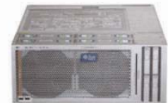
Sun announces new servers powered by the Six-Core AMD Opteron™ processor